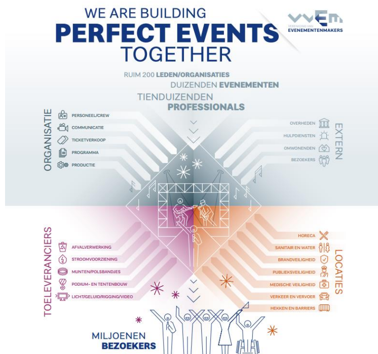
Figuur - VVEM Factsheet Evenementen

De eerste stappen moeten nu gezet worden. Het is van groot belang de bestaande organisatoren, locaties en leveranciers met hun medewerkers (werkzaam in een zeer breed scala, denk aan podiumtechniek, horeca, evenementenbeveiliging), weer aan het werk te helpen. Er is de zeer grote poule zzp'ers, die willen we ook zo snel mogelijk weer aan de slag krijgen. Onze belangrijkste motivatie deze industrie weer op gang te helpen is dat we ons verantwoordelijk voelen voor onze bezoekers en medewerkers. Zij moeten erop kunnen vertrouwen dat we samen mooie evenementen organiseren, produceren en vooral beleven.