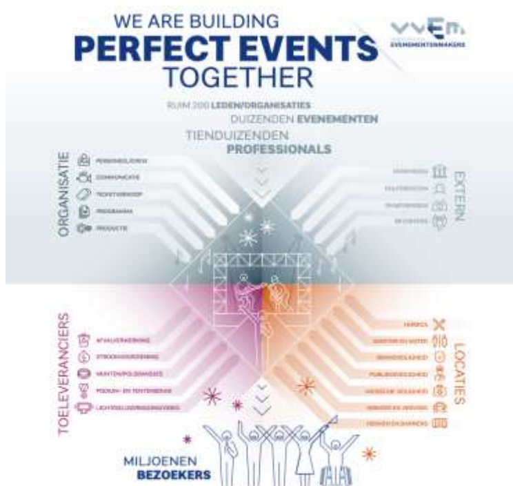
Figuur - VVEM Factsheet Evenementen

De eerste stappen moeten nu gezet worden. Het is van groot belang de bestaande organisatoren, locaties en leveranciers met hun medewerkers (werkzaam in een zeer breed scala, denk aan podiumtechniek, horeca, evenementenbeveiliging), weer aan het werk te helpen. Er is de zeer grote poule zzp'ers, die willen we ook zo snel mogelijk weer aan de slag krijgen. Onze belangrijkste motivatie deze industrie weer op gang te helpen is dat we ons verantwoordelijk voelen voor onze bezoekers en medewerkers. Zij moeten erop kunnen vertrouwen dat we samen mooie evenementen organiseren, produceren en vooral beleven.