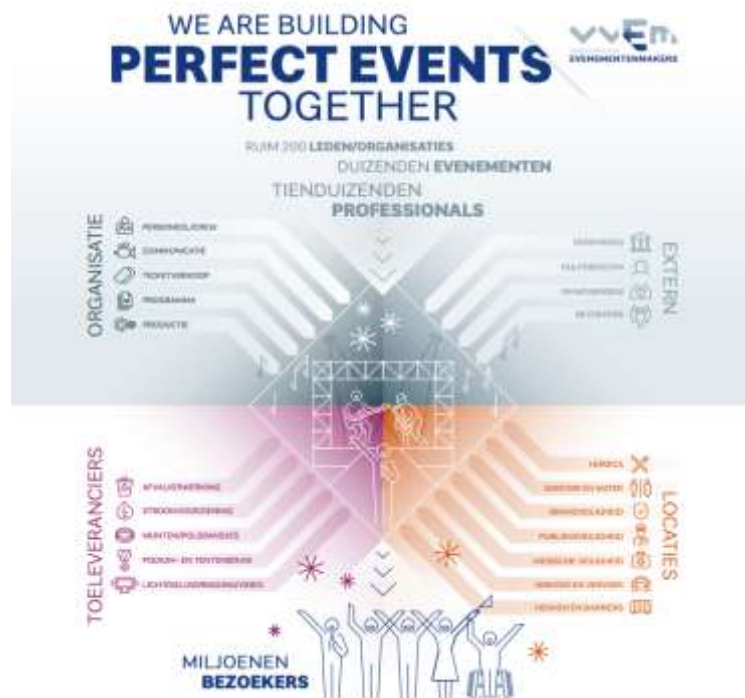
Figuur - VVEM Factsheet Evenementen

De eerste stappen moeten nu gezet worden. Het is van groot belang de bestaande organisatoren, locaties en leveranciers met hun medewerkers (werkzaam in een zeer breed scala, denk aan podiumtechniek, horeca, evenementenbeveiliging), weer aan het werk te helpen. Er is de zeer grote poule zzp'ers, die willen we ook zo snel mogelijk weer aan de slag krijgen. Onze belangrijkste motivatie deze industrie weer op gang te helpen is dat we ons verantwoordelijk voelen voor onze bezoekers en medewerkers. Zij moeten erop kunnen vertrouwen dat we samen mooie evenementen organiseren, produceren en vooral beleven.