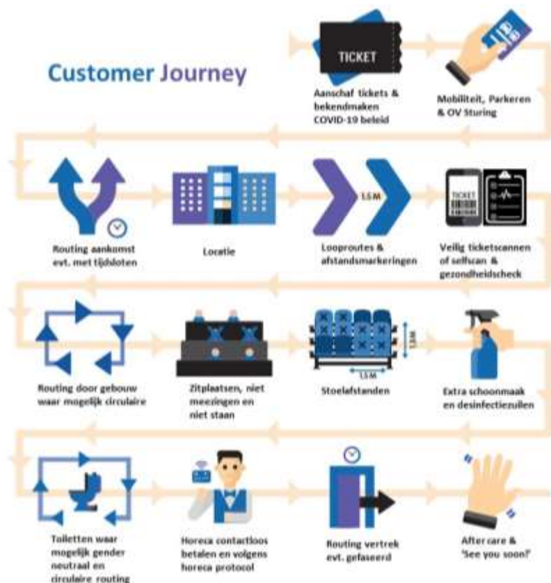
Figuur – Voorbeeld van een 'customer journey' bij een evenement met 1,5 meter, en overige, maatregelen van kracht, maar nog zonder Testen voor Toegang. Er zal later ook een Testen voor Toegang variant worden toegevoegd aangezien routing door gebouw, zitplaatsen, stoel afstanden e.d. niet van toepassing voor events met groene zone.

De maatregelen voor bezoekers worden beschreven aan de hand van de zogenaamde 'customer journey', waarbij afstand, bescherming, hygiëne en handhaving in acht zijn genomen. Deze kenmerken komen terug in het gehele proces.